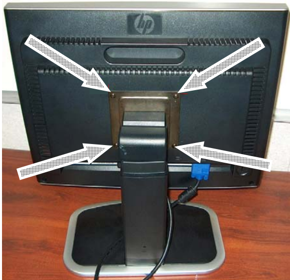
Figura 1a: Brazo de soporte del monitor L2035

DESCRIPCIÓN DEL PROBLEMA: Es posible que los componentes de metal expuestos en algunos de los monitores L2035, con números de serie comprendidos entre CNP352xxxx y CNP423xxxx, no cuenten con una toma de tierra adecuada y que, en su lugar, estén conectados a un voltaje peligroso. Por lo tanto, se podrían producir descargas eléctricas al entrar en contacto con el brazo de soporte (señalado en la Figura 1a) o con la base del monitor (señalada en la Figura 1b), o con cualquier pieza conductora que esté en contacto con uno de los citados componentes.