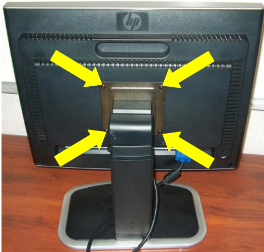
그림 1a: L2035 모니터의 스탠드 설치 브래킷

문제에 대한 세부 설명: CNP352xxxx 에서 CNP423xxxx 까지의 일련번호 범위에 속하는 L2035 평면 모니터 중 일부가 올바르게 접지되지 않아 위험한 전압에 연결되었을 수 있습니다. 따라서 스탠드 설치 브래킷(그림 1a 에 화살표로 표시) 또는 모니터 받침(그림 1b 에 화살표로 표시)과 접촉하거나 이 둘 중 하나에 접촉되어 있는 전도성 부품과 접촉할 경우 감전을 일으킬 수도 있습니다.