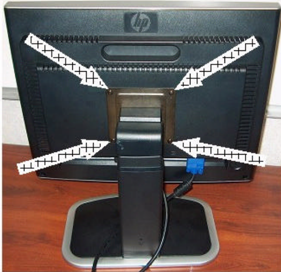
Figur 1a: Standerens monteringsbeslag på skærmen L2035

PROBLEMET I DETALJER: Ubeskyttede metaloverflader på de pågældende skærme type L2035 inden for serienummerområdet CNP352xxxx til CNP423xxxx, er muligvis ikke jordet korrekt, men er i stedet tilsluttet farlig spænding. Følgelig kan brugerne få elektrisk stød, hvis de berører standerens monteringsbeslag (se pilene i Figur 1a) eller skærmens bund (se pilen i Figur 1b) eller ledende dele, der har kontakt med en af disse dele.